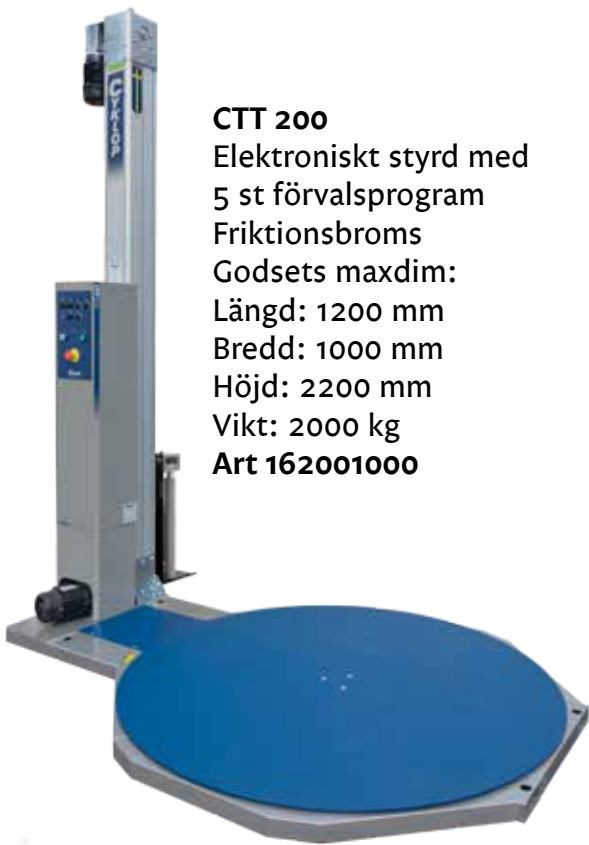
CTT 200 Elektroniskt styrd med 5 st förvalsprogram Friktionsbroms Godsets maxdim: Längd: 1200 mm Bredd: 1000 mm Höjd: 2200 mm Vikt: 2000 kg Art 162001000