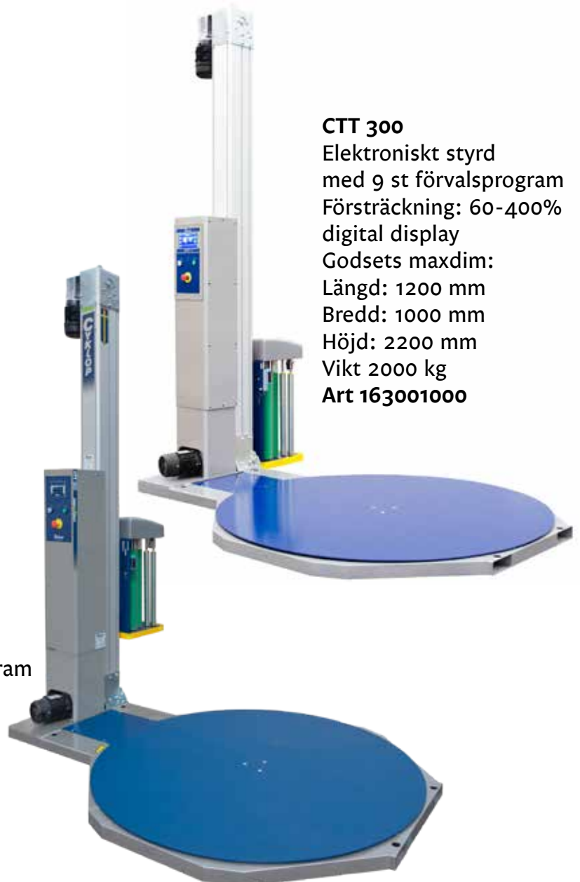
CTT 300 Elektroniskt styrd med 9 st förvalsprogram Försträckning: 60-400% digital display Godsets maxdim: Längd: 1200 mm Bredd: 1000 mm Höjd: 2200 mm Vikt 2000 kg Art 163001000