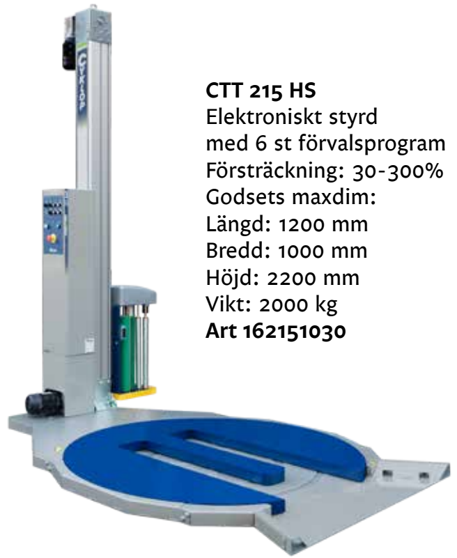
CTT 215 HS Elektroniskt styrd med 6 st förvalsprogram Försträckning: 30-300% Godsets maxdim: Längd: 1200 mm Bredd: 1000 mm Höjd: 2200 mm Vikt: 2000 kg Art 162151030