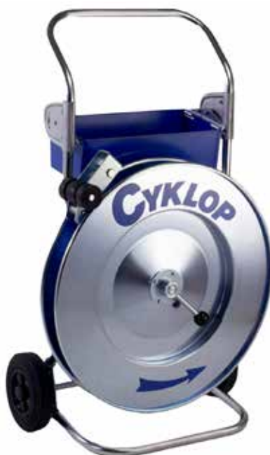
CA 621 Avrullare