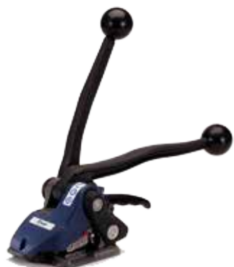
Stålbandningsverktyg CH 47 för stålbandning