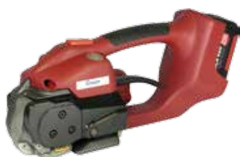
Cyklop CMT 250 Friktionssvets

Halvautomatisk bandningsmaskin Ramstorlek: 850 x 600 mm Kapacitet: 25 bandningar /min Min. godsmått: B x H, 130 x 20 mm Max. godsmått: B x H, 820 x 570 mm